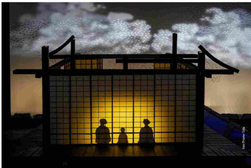
“Madama Butterfly”, foto di Priamo Tolu

Come ormai da tradizione, la stagione si aprirà con un titolo poco battuto, questa volta, “ Nerone ”, ma nuovo nell’allestimento firmato proprio dal Teatro Lirico di Cagliari dove resterà in cartellone dal 9 al 18 febbraio. Dal 15 al 24 marzo sarà la volta di “ Tosca ”, diretta da Beatrice Venezi ( qui l'intervista per Nemesis Magazine ) e con il soprano Veronika Dzhioeva nel ruolo della fatale, volubile e passionale eroina pucciniana. “ L’Italiana in Algeri ” di Rossini farà invece la sua comparsa dal 3 al 12 maggio dopo un’assenza dal capoluogo sardo durata ventisette anni, nell’allestimento del Teatro Regio di Torino e con la regia di Vittorio Borrelli . A dirigere Orchestra e Coro sarà il famoso direttore inglese Jan Latham-Koening . “ Madama Butterfly ” approderà dal 28 giugno al 7 luglio nell’allestimento originale del Teatro alla Scala , con la regia di Daniela Zedda da un’idea di Keita Asari , celebre regista cinematografico e teatrale giapponese. Sul fronte coreutico, “ La fille mal gardée ” andrà in scena dal 21 al 26 maggio con le musiche di Peter Ludwig Hertel .